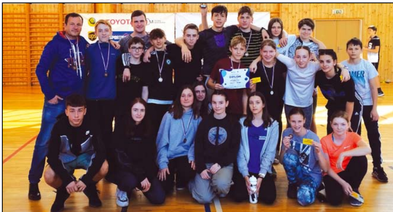
Náš bronzový tým

Naše základní škola se ve středu 22. března 2023 zúčastnila Sazka Olympijského víceboje, který je největším školním sportovním projektem v České republice. Je určený základním školám a odpovídajícím ročníkům víceletých gymnázií, které se mohou s dětmi jednoduše zapojit v hodinách tělesné výchovy.