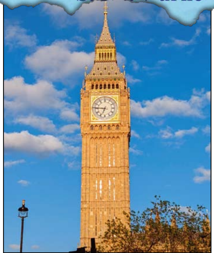
Tex a foto Šárka Fischerová, 9. D